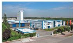
EROGLU TR - BURSA