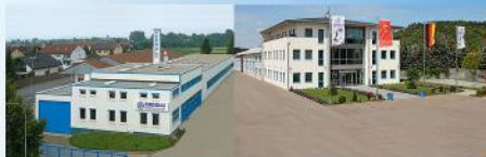
EROGLU DE - MÖSSINGEN